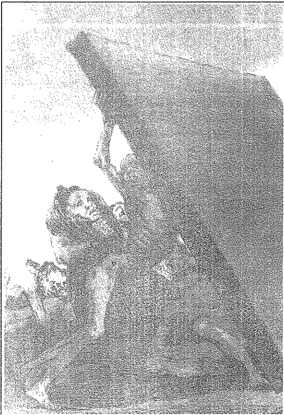
Y aún no se van!

Desde la óptica de los ingresos se trata de un incremento general en las tasas impositivas (directas e indirectas), sin que ello represente una modificación en la concepción y la estructura de los gravámenes. El aumento de los impuestos a las rentas y el capital —que podría significar el “retorno” a una estructura de progresividad impositiva—, se ha acompañado, no obstante, de impuestos a las capas me-